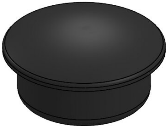
Tappo di chiusura A